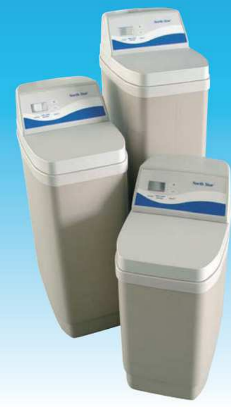
NORTH STAR NSC 11, 14 & 17 ED

Ein North Star Wasserenthärter ist ein meisterhaftes Beispiel der modernsten Technologie; die beste Lösung für die meisten Familien.