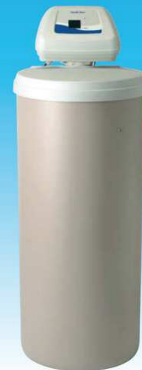
NORTH STAR NSC 25 ED

Dieser North Star Wasserenthärter trifft leicht die Bedürfnisse von Kleinunternehmen (Friseursalon, Bäckerei ...), die großes Volumen von Wasser in Ihrem Produktionsprozess verlangen.